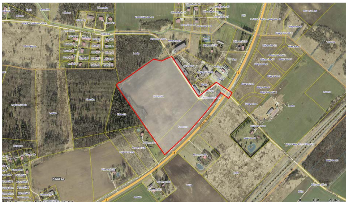
Skeem 1. Planeeringuala piir vastavalt algatamise korraldusele.

Planeeringu eesmärgid on kooskõlas kehtiva Kambja valla üldplaneeringuga. Üldplaneeringu järgne maakasutus on äri- ja tootmismaa.